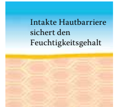
Intakte, schützende Hautbarriere mit Linol-säure-reichen Lipiden

Weitere Informationen stehen für Sie bereit unter www.linola.com