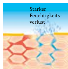
Lipidverlust führt zu einer gestörten Hautbarriere: Die Haut verliert viel Wasser und trocknet aus.