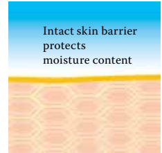
Intact protective skin barrier with lipids rich in linoleic acids.

Visit us at www.linola.de and select the drop-down menu "country". Here you will find all the latest information on Linola Lotion , Linola Face , Linola Hand and Linola Foot Lotion as well as other Linola products for a wide range of skin problems.