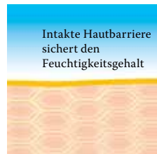
Intakte, schützende Hautbarriere mit Linolsäure-reichen Lipiden.

Um diesen Barrierestörungen sowie Fett- und Feuchtigkeitsdefiziten trockener Haut entgegenzuwirken und sie vor weiteren Schäden zu schützen, ist daher sowohl eine regelmäßige Pflege als auch eine schonende Reinigung unerlässlich. Deshalb gibt es von Linola spezielle Produkte, die aufeinander abgestimmt sind und zudem gerade für den Körper, den Kopf, das Gesicht, die Hände oder die Füße besonders geeignet sind. Besuchen Sie uns unter www.linola.de . Denn dort haben wir für Sie alle aktuellen Informationen über Linola Hautmilch , Linola Gesicht , Linola Hand und Linola Fuß-Milch sowie zu weiteren Linola-Produkten bei verschiedenen Hautproblemen bereitgestellt.